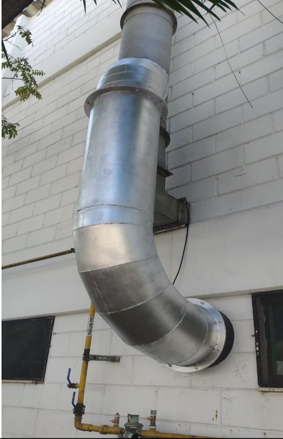
Duto de chaminé diâmetro de 500 milímetros em aço carbono