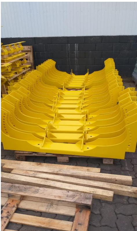
Cavalete de carga com regulagem de altura dos rolos