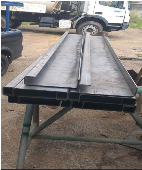
Chapa 1/4 dobrada comprimento 3 metros