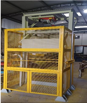
Entonador de caçambas