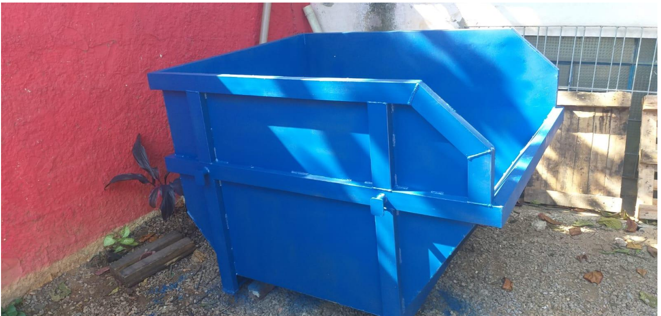
Caçamba para sucata