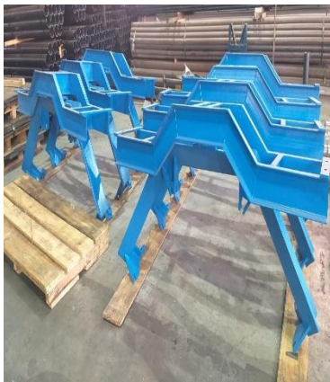
Cavaletes para transportadores alto aliantes