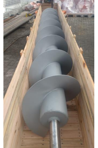
Rosca transportadora helicoidal em aço carbono carbono