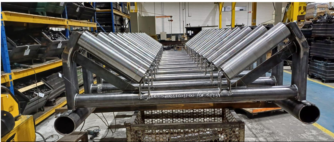
Cavalete de carga em aço carbono tubo de 6 polegadas