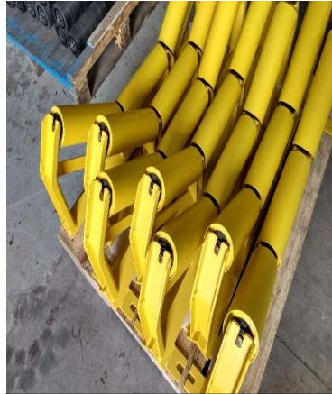
Cavalete para transportador de correia