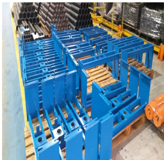
Cavalete alto aliante