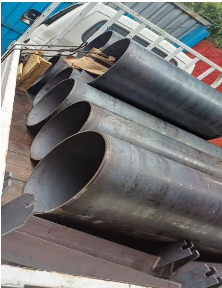
Tubos calandrados de chapa 3/8 em aço carbono