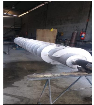
Rosca helicoidal em inox 304