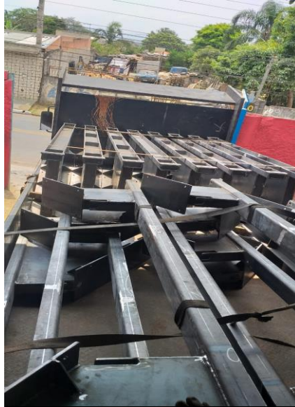
Cavalete para esteira transportadora