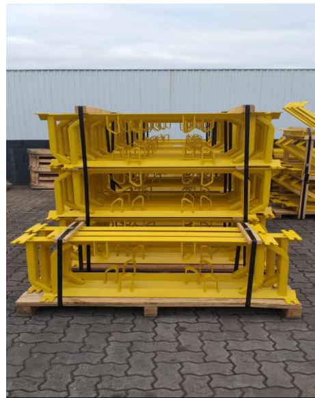
Cavalete de carga