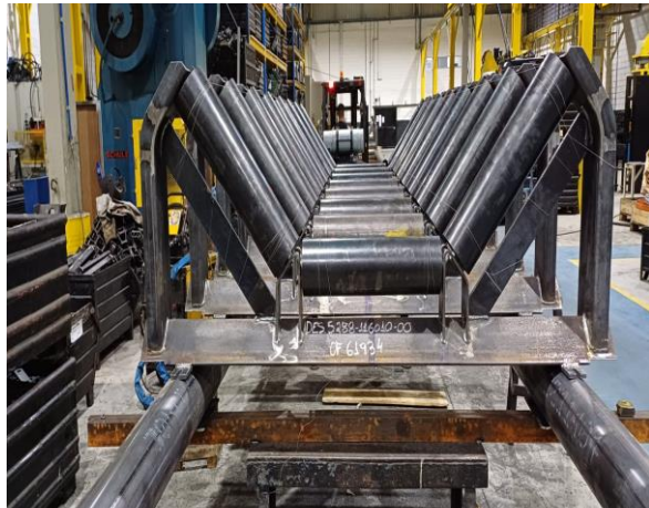
Cavalete de cargas em aço carbono